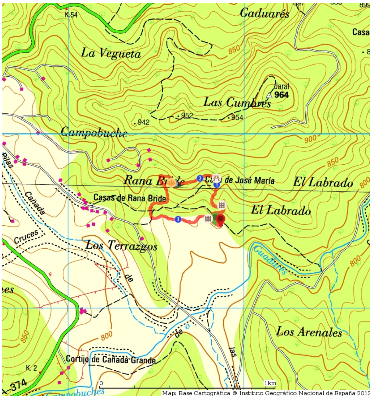
Map: Base Cartográfica © Instituto Geográfico Nacional de España 2012.